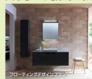
フローティングデザインプラン