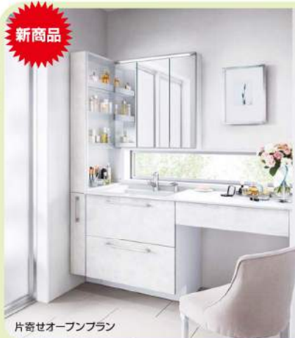
片寄せオープンプラン