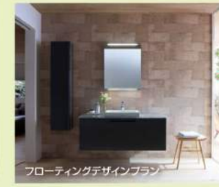
フローティングデザインプラン