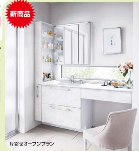
片寄せオープンプラン